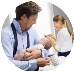
Beruf und Familie