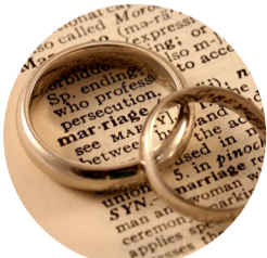
Das Wesen der Ehe

Eine glückliche, erfüllende Ehe ist eine Lebensaufgabe und ein fortlaufender Prozess. Liebe, Zärtlichkeit und Respekt sind der Schlüssel zu einer gelungenen Ehe. Liebe ist dabei nicht nur ein Gefühl, sondern eine Entscheidung. Eine erfüllende Ehe ist daher kein Zufallsprodukt, sondern das Ergebnis von andauernder Anstrengung, die Partnerschaft zu stärken und die Freundschaft durch effektive Kommunikation und das hingebungsvolle, gegenseitige Sich-Schenken zu vertiefen.